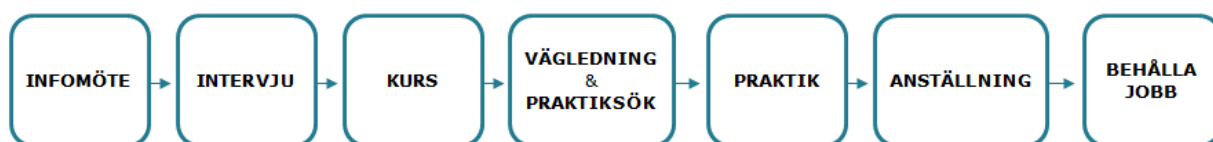
Figur 1.1: Kramikursen och dess ingående delar

Att delta i Kramikursen är frivilligt. De som tillhör målgruppen får genom ett informationsmöte veta mer om verksamheten och målsättningen med att delta. För att kunna börja kursen krävs att en personlig intervju genomförs. Efter intervjun planerar Krami-handläggarna tillsammans med den potentiella deltagaren och dennes aktuella myndighetshandläggare vilken kursstart under året som är lämpligast. Benämningen "Kurs" i Figur 1.1 gäller den så kallade vägledningskursen som startar vid tio tillfällen per år (fem för kvinnor och fem för män). Dessa genomförs i grupp under tre sammanhängande veckor för kvinnor och två sammanhängande veckor för män. Kvinnorna är oftast fyra till sex deltagare per kurs, men vid några tillfällen har det varit åtta deltagare. Männerna är ofta sex till åtta deltagare med ett maxantal på tio. I samband med att en vägledningskurs startar görs en överenskommelse om samarbete mellan de aktuella deltagarna och Krami.